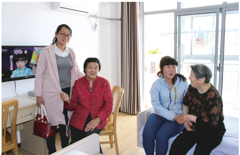
4月18日下午,利海化工公司团委组织青年志愿者前往连云区社会福利中心开展“走进敬老院,关爱老人”志愿服务活动。志愿者服务队给老人们送去了牛奶、八宝粥、饼干、水果等慰问品,并帮助老人打扫卫生,与老人亲切交流,让老人们感受到社会的关心和关怀。(顾孟琳)

“任前约谈”,上好廉政第一课。对新提拔任用的部门单位干部及时采取集体谈话与个别谈话相结合的形式,围绕党风廉政建设和反腐败工作的形势任务、谈话对象和所在单位、部门党风廉政建设状况以及存在问题等方面,推动主体责任落到实处。(房宣)