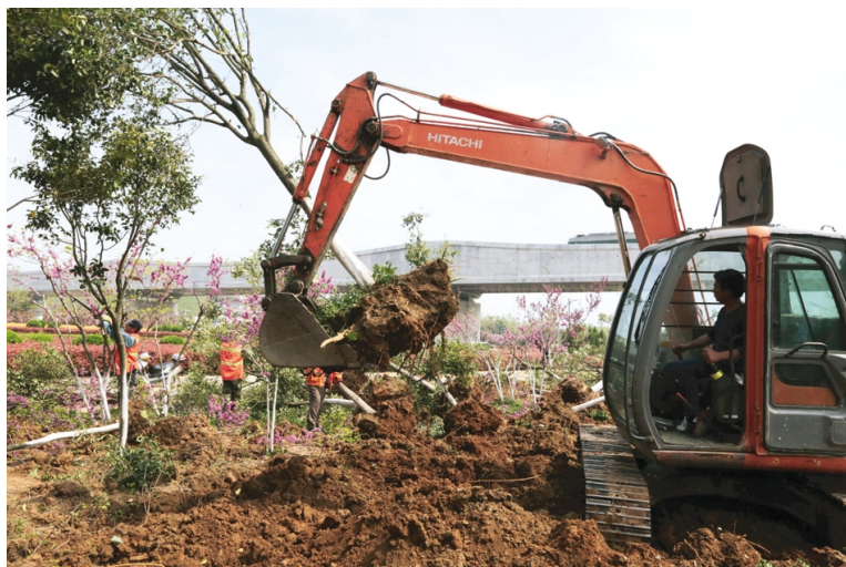
由于242省道与港城大道立交工程施工,港城大道朝阳至开发区路段绿化苗木需迁移。4月14日,华茂绿化工程公司组织人员、机械到该路段移苗现场作业,计划在一周内移植大叶女贞、紫玉兰等乔木300多棵,金叶女贞、海桐等模纹700多平方米。图为挖掘机起卸树木。(张青松)