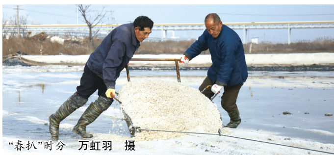
“春耕”时分