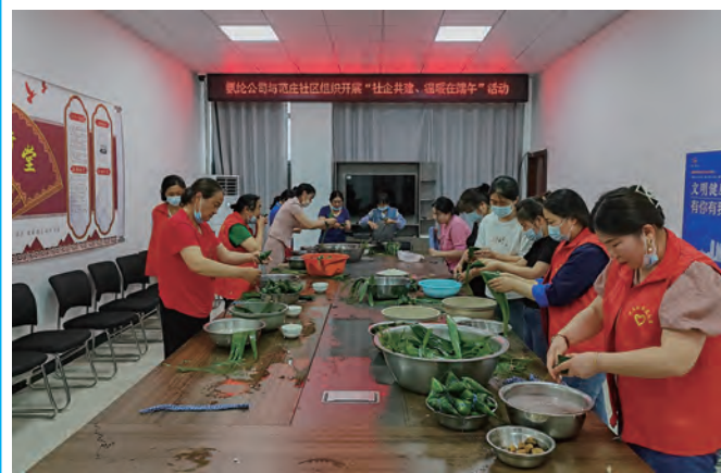
6月19日上午,氨纶公司联合范庄社区开展“社企共建,温暖在端午”活动,双方就新时代党建引领下的社企共建工作进行了深入交流,并与社区居民开展包粽子比赛,为空巢老人和困难群众送上了粽子、大米、牛奶、食用油等慰问品。(韩奇)