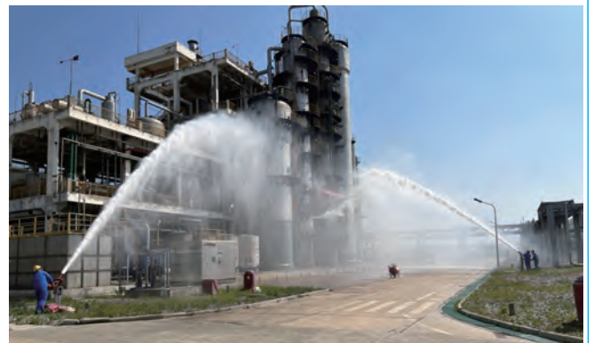
6月14日,利海化工公司开展双氧水装置氧化塔一楼平台发生氢化液泄露火灾事故应急救援演练。通过此次应急演练活动,进一步增强了各应急职能组之间相互配合能力和事故发生后迅速报警和应急响应能力,用实际行动守住安全生产红线。(张昕)

安全管控有提升。逐级签订安全目标责任书,坚持三级安全巡查制度。有序组织职业健康卫生、交通安全、安全法规培训,按流程完成转岗员工、临时用工人员的培训,各项培训人员750余人次。投入5.9万余元,严格流程将23条安全隐患整改到位。悬挂横幅20余条,发放酒驾、醉驾宣传画30余张和防灾减灾宣传册300余份。(陈守兵)