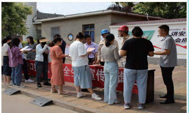
6月16日,供电工程分公司青口供电所联合青口投资公司开展安全用电宣传活动,现场发放《安全用电知识手册》《居民节约用电指南》等宣传资料100余份。(张长晓)