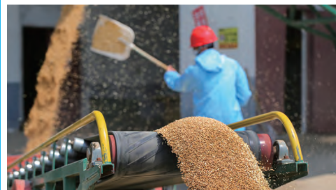
近日,青口投资公司仓储中心全力抓好耐盐碱小麦烘干收储工作,数台大型烘干设备高速运转,刚刚收获的耐盐碱小麦经过筛选除杂后,被传送设备送入烘干仓,烘干后经过输送带直接送入粮仓,把丰收牢牢抓在手上。