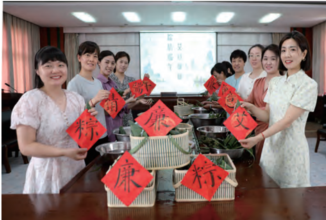
6月16日,青口投资公司纪委在端午节前邀请部分干部家属和女职工代表,开展“粽情端午·艾意廉廉”主题活动,在端午习俗中融入廉洁元素,彰显节日新风。(瞿方)

做准重点监督。在嵌入“海福特”鲑鱼加工项目监督中,选派专职纪检员加强对物资采购、加工仓储、生产销售等重要环节的监督,分析研判问题根源,提出质疑和整改要求,形成运营风险情况报告,促进即食鲑鱼加工项目规范有序运行。(北纪)